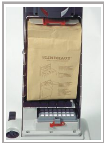
Filtro a Carboni Attivi / Microfiltri Filtro Hepa Classe-S

Activa è equipaggiata di serie con 6 stadi di filtraggio. Allo stadio finale, un microfiltro elettrostatico (3M Filtrete) assicura più del 98% di efficienza filtrante a 0.3 micron. Si possono inoltre installare i filtri opzionali Hepa classe - S per ambienti sanitari, che assicurano un'efficienza filtrante del 99.97% a 0.3 micron. Per intrappolare i cattivi odori, la Lindhaus ha studiato una speciale cassetta con Carboni attivi / microfiltri.