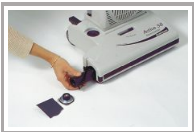
Sostituzione del rullo

Activa è equipaggiata di serie con 6 stadi di filtraggio. Allo stadio finale, un microfiltro elettrostatico (3M Filtrete) assicura più del 98% di efficienza filtrante a 0.3 micron. Si possono inoltre installare i filtri opzionali Hepa classe - S per ambienti sanitari, che assicurano un'efficienza filtrante del 99.97% a 0.3 micron. Per intrappolare i cattivi odori, la Lindhaus ha studiato una speciale cassetta con Carboni attivi / microfiltri.