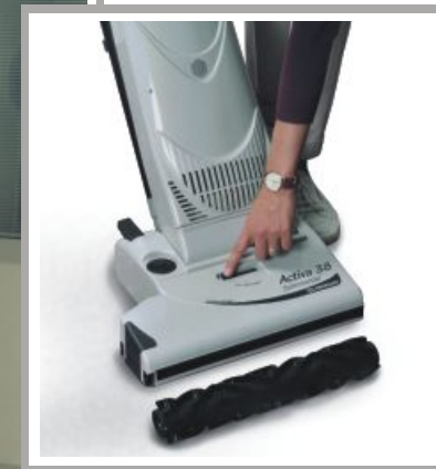
Sistema di lavaggio a secco

Si chiude il canale di aspirazione, si cambia il rullo e la macchina è pronta per lavare a secco il Vostro tappeto o moquette. I prodotti ecologici Lindhaus, sono disponibili per la manutenzione di qualsiasi superficie tessile.