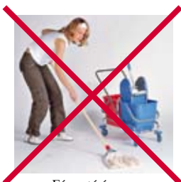
Fárasztó és nem hatékony a felmosás, valamint hosszú a száradási idő? LW 30 - 38 pro a megoldás!

A Lindhaus LW 30 - 38 pro minden mosható padlózaton ideális, a legdurvábbtól a legkényesebbig. A készülék kezelhetősége és a keféhez alacsony profilja valóban könnyű és felhasználóbarát kezelhetőséget biztosít. A készülék tökéletesen felszívja a padlózatról a tisztítószert, így nem kell várni a száradásra, és a munkát követően a helyiség azonnal használható.