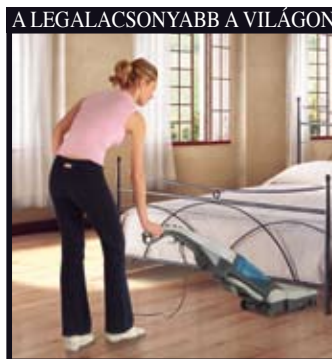
A LEGALACSONYABB A VILÁGON

A tartály dugója, egyben egy adagoló is. Az 1% Lindhaus tisztítószert (feltöltésnél 26 ml.) 60 m2 felmosására elegendő az LW 30, 80 m2 az LW 38 típusnál. A tisztítószert felhasználása minimális, és összehasonlítva a ma ismert felmosási rendszerekkel, figyelembe véve a víz és szer felhasználást, mondhatjuk, hogy az LW 30-38 kb. 10 szer takarékosabb a ma ismert technológiáknál, legyen az kézi vagy gépi.